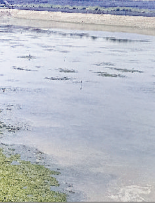
रेवाड़ी। कालाका में वाटर टैंक की दिखने लगी जमीन।