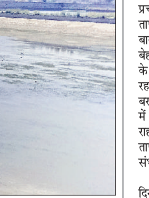
रेवाड़ी। कालाका में वाटर टैंक की दिखने लगी जमीन।