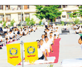
रेवाड़ी। सैनिक स्कूल में योगाभ्यास करते कैडेट्स तथा मेधावी कैडेट्स को सम्मानित करते हुए।

योग मात्र शारीरिक क्रिया ही नहीं है, बल्कि यह मनुष्य को मानसिक, भावनात्मक और आत्मिक विचारों पर नियंत्रण करने के योग्य बनाता है। हरिभूमि न्यूज। रेवाड़ी