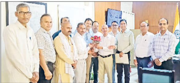
रेवाड़ी। एसडीएम बावल से मिलते हजरस के पदाधिकारी।

बावल। शिक्षा विभाग की ओर से जलियावास के राजकीय मॉडल संस्कृति प्राथमिक स्कूल को माध्यमिक स्तर तक अपग्रेड करने की प्रक्रिया शुरू हो गई है। इस संबंध में मौलिक शिक्षा निदेशालय पंचकुला की ओर से जिला मौलिक शिक्षा अधिकारी को पत्र जारी किया गया है। पत्र के अनुसार अब विद्यालय को राजकीय मॉडल संस्कृति माध्यमिक विद्यालय, जलियावास के नाम से उन स्कूल पोर्टल पर अपडेट किया जाएगा। निदेशालय ने संबंधित स्कूल का डीडीओ यूजर कोड, सैलरी कोड और यू-डायस कोड सहित सभी आवश्यक जानकारी शीघ्र भेजने के निर्देश दिए हैं।