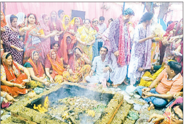
रेवाड़ी। कथा के समापन पर हवन में भाग लेते श्रद्धालु।