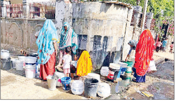
नांगल चौधरी। पेयजल के इंतजार में सुबह पांच बजे सार्वजनिक टैंक पर एकत्रित महिलाएं।

रातभर कतार में खड़ी होने को मजबूर हैं महिलाएं, प्रशासन बना अनजान