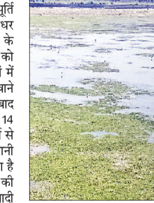
रेवाड़ी। कालाका में वाटर टैंक की दिखने लगी जमीन।

सप्लाई दी जा रही है। पानी की पूर्ति के लिए लोगों को इधर-उधर भटकना पड़ रहा है। लोगों गर्मी के मौसम में हैडपंप से पानी भरने को मजबूर है। संकरों व कॉलोनियों में तो लोगों को पानी के टैंकर मंगवाने पड़ रहे हैं। नहर बंद होने के बाद कालाका वाटर वर्क्स से पिछले 14 दिन से और लिसाना वाटर वर्क्स से चार दिन से राशनिंग करके पानी दिया जा रहा है। लोगों का कहना है कि सरकार व प्रशासन की ओर से बढ़ती आबादी के साथ वाटर टैंक नहीं बढ़ाए जा रहे हैं। पिछले एक दशक से शहर दो वाटर वर्क्स के 8 वाटर टैंकों पर ही निर्भर है, जिससे लोगों को पानी की पूर्ति नहीं हो पा रही है। लोगों को गर्मी के मौसम में भी पानी की एक-एक बूंद के लिए तरसना पड़ रहा है।