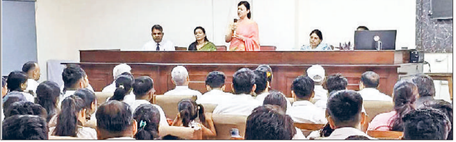
रेवाड़ी। आईजीयू में आयोजित कैंप में जानकारी देते हुए सीजेएम डॉ. सोलखे।

मुख्य न्यायिक दंडाधिकारी कम सचिव जिला विधिक सेवा प्राधिकरण डा. रेनु सोलखे के मार्गदर्शन में मंगलवार को आईजीयू में हरियाणा राज्य विधिक सेवा प्राधिकरण के प्रोजेक्ट लैंगिक अपराधों से बालकों का संरक्षण अधिनियम 2012 के अंतर्गत पोक्सो एक्ट पर स्पेशल कैंप का आयोजन किया गया। इस अवसर पर सीजेएम डा. सोलखे ने बताया कि पोक्सो एक्ट 2012 18 वें से कम उम्र के बच्चों को यौन शोषण, उत्पीड़न और अश्लीलता से बचाने के लिए है। यह कानून लिंग तटस्थ है, यह लड़के