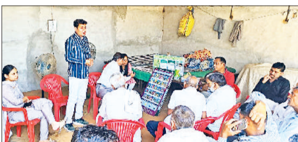
रेवाड़ी। किसानों को जानकारी देते हुए कृषि वैज्ञानिक।

केंद्रीय कृषि एवं किसान कल्याण मंत्रालय के क्षेत्रीय एकीकृत नाशी जीव प्रबंधन केंद्र की वैज्ञानिक टीम की ओर से मंगलवार को गांव गोठड़ा अहीर में किसान गोष्ठी का आयोजन किया गया। इस मौके पर किसानों को बीजोपचार के उद्देश्य व लाभ की जानकारी दी गई। उन्होंने फसलों की बुआई से पहले बीजोपचार की विधि से भी अवगत कराया। किसानों को कीटनाशकों के सुरक्षित एवं विवेकपूर्ण उपयोग के बारे में भी बताया गया। उन्होंने कपास की फसल में लगने वाले कीट व बीमारियों की जानकारी दी। कृषि वैज्ञानिकों ने बताया कि किसान नियमित रूप से फसल की